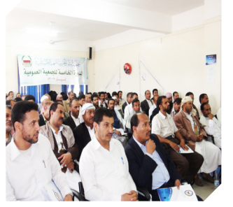
لتنمية الوطن نعمل.. على قلب رجل واحد الدورة الخامسة للجمعية العمومية