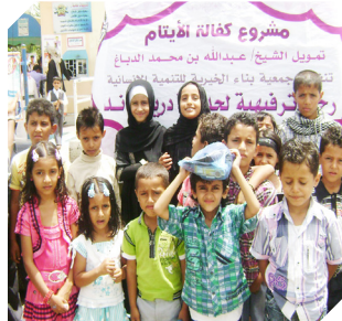
بسملة اليتيم.. دفع مسبق لمرافقة الحبيب (ص)