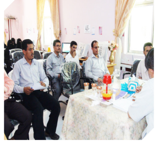
إصرار على التميز ورغبة في الريادة اجتماع دوري للعاملين في الجمعية