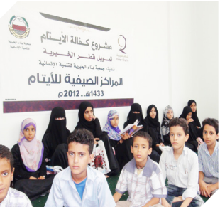
المراكز الصفيفية للأيتام في رحاب الطهر .. تبني الأجيال