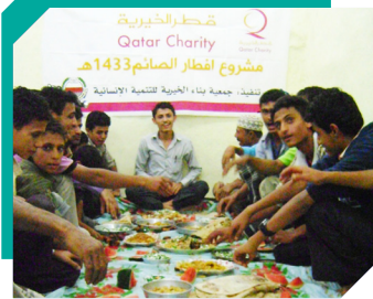
أكل طعامكم الأبرار.. وكتب أجركم الفطار مشروع إفطار الصائم

في أحد الأيام وصل الموظفون إلى مكان عملهم فرأوا لوحة كبيرة معلقة على الباب الرئيسي لمكان العمل كتب عليها: «لقد توفي البارحة الشخص الذي كان يعيق تقدمكم ونموكم في هذه الشركة! .. ونرجو منكم الدخول وحضور العزاء في الصلاة المخصصة لذلك!» في البداية حزن جميع الموظفون لوفاة أحد زملائهم في العمل ، لكن بعد لحظات تملك الموظفون الفضول لمعرفة هذا الشخص الذي كان يقف عائقاً أمام تقدمهم ونمو شركتهم بدأ الموظفون بالدخول إلى قاعة وضع بها تابوت وتولى رجال أمن الشركة عملية دخولهم ضمن دور فردي لرؤية الشخص داخل التابوت وكلما نظر شخص لما يوجد بداخل التابوت أصبح وبشكل مفاجئ غير قادر على الكلام وكأن شيئاً ما قد لاسم أعماق روحه لقد كان هناك في أسفل الكفن امرأة تعكس صورة كل من ينظر إلى داخل الكفن وبجانبتها لافتة صغيرة تقول هناك شخص واحد في هذا العالم يمكن أن يضع حداً لمطوحاتك ونموك في هذا العالم وهو أنت» .. حياتك لا تتغير عندما يتغير مديرك أو يتغير أصدقائك أو زوجتك أو مكان عملك أو حالتك المادية. حياتك تتغير عندما تتغير أنت وتقف عند حدود وضعها أنت لنفسك! راقب شخصيتك وقدراتك ولا تخف من الصعوبات والخسائر والأشياء التي تراها مستحيلة.