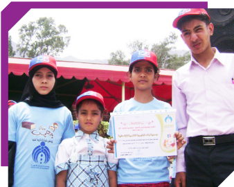
افتح يا مستقبل أبوابك تكريم أيتام الجمعية من قبل مؤسسة إنسان