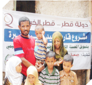
مشاريع قوارب الصيد علمني حرفة .. لأعيش بكرامة