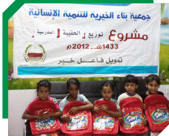
اعطني جيلاً متعلماً.. أعطك مستقبلاً آمناً توزيع الحقبة المدرسية لأيتام الجمعية