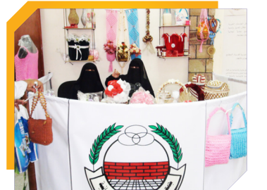
ومعظم النهضات من مستصغر المهن جناح الجمعية في معرض الحرف اليدوية