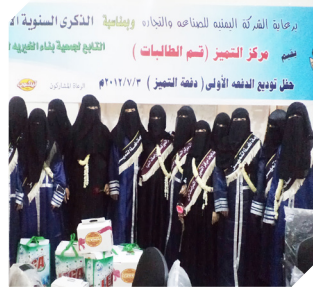
استعداد لبناء الوطن .. بكفاءة ومهنية حفل توزيع الدفعة الأولى من مركز الطالبات