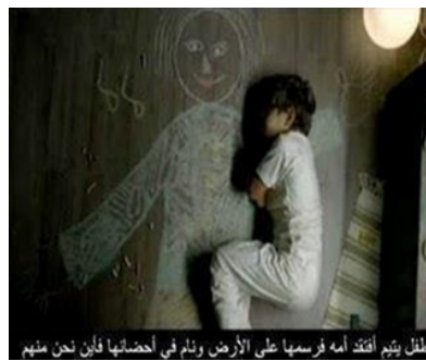
طلعت بينم أفقت أمه فرسما على الأرض ونام في أحضانها فأين نحن منهم