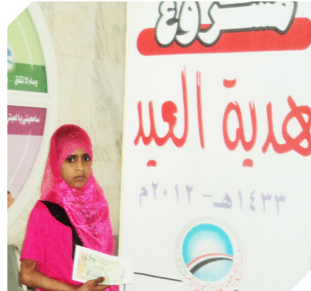
مرضى السرطان أتم صارخ .. وأجر متعاظم