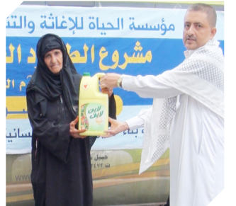
الطرود الغذائية انقاذ حياة .. وإعفاف أسر