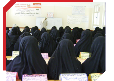
تأهيل المرأة.. شرط أكيد لجيل فريد دورة تدريبية لمعلمات القرآن الكريم