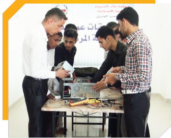
دقائق التدريب غالية تطبيقات عملية لطلاب مركز التميز الخيري