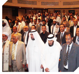
حضور مشرف .. ومشاركة دوتية الجمعية في حفل افتتاح مكتب قطر الخيرية

تعليق: محمود أبو خليفة