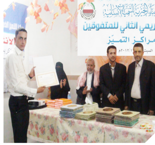
بناء الإنسان .. نهضة وطن.. وفخر أمة حفل تكريم المتفوقين في مراكز التميز